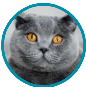
Britisch Kurzhaar Katze